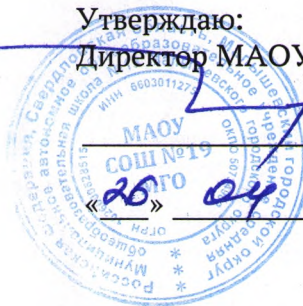
График выдачи учебников на 2024-2025 учебный год.