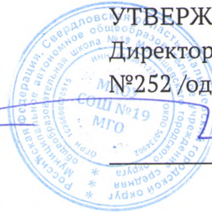
ГРАФИК ПИТАНИЯ УЧАЩИХСЯ МАОУ СОШ № 19 МГО НА 2024- 2025УЧЕБНЫЙ ГОД