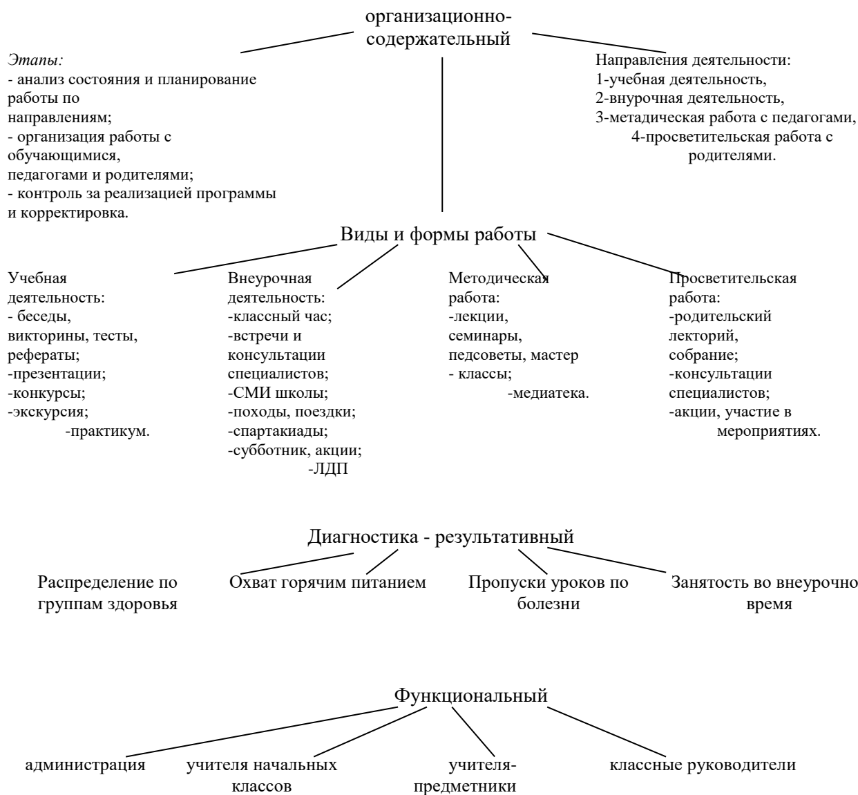
Виды деятельности и формы занятий по формированию экологической культуры, здорового и безопасного образа жизни